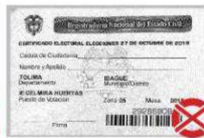
En blanco y negro