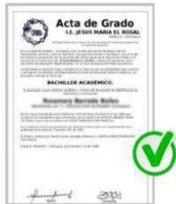
Documento escaneado verticalmente un solo documento por archivo