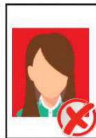
AMPLIADAS O EN HOJA DE DOCUMENTO