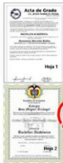
Más de un documento escaneado en un solo pdf