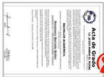
Documento escaneado horizontalmente