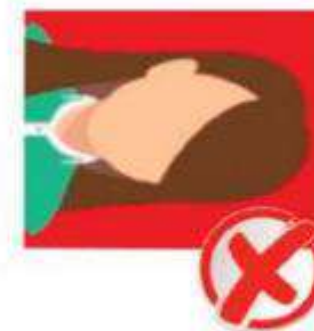
GIRADAS O DESENFOCADAS